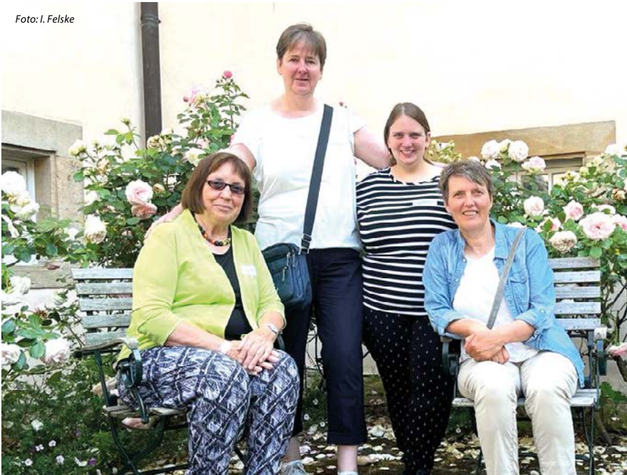
Planen mit den Kirchenvorständen zusammen das regionale Gemeindebüro: Unsere Sekretärinnen

Nach der laufenden Personalplanung im Kirchenkreis Laatzen-Springe werden die vier Gemeinden der Kirchenregion Hemmingen im Laufe der nächsten fünf Jahre mit etwa 20% weniger Stunden in den Gemeindebüros auskommen müssen. Wenn wir die gewohnte und aus unserer Sicht sehr wichtige Präsenz vor Ort aufrechterhalten wollen, heißt das: Wir müssen über Möglichkeiten der Vereinfachung und Effizienzverbesserung sprechen. Und genau das haben die vier Gemeinden der Kirchenregion in den vergangenen Monaten getan. Daraus entstanden ist das Projekt „Regionales Gemeindebüro“ für die Kirchenregion Hemmingen. Nach dem aktuellen Stand der Planungen soll das neue regionale Gemeindebüro in den Räumen